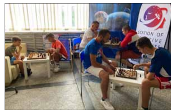
Fot. KS PODWAWELSKI